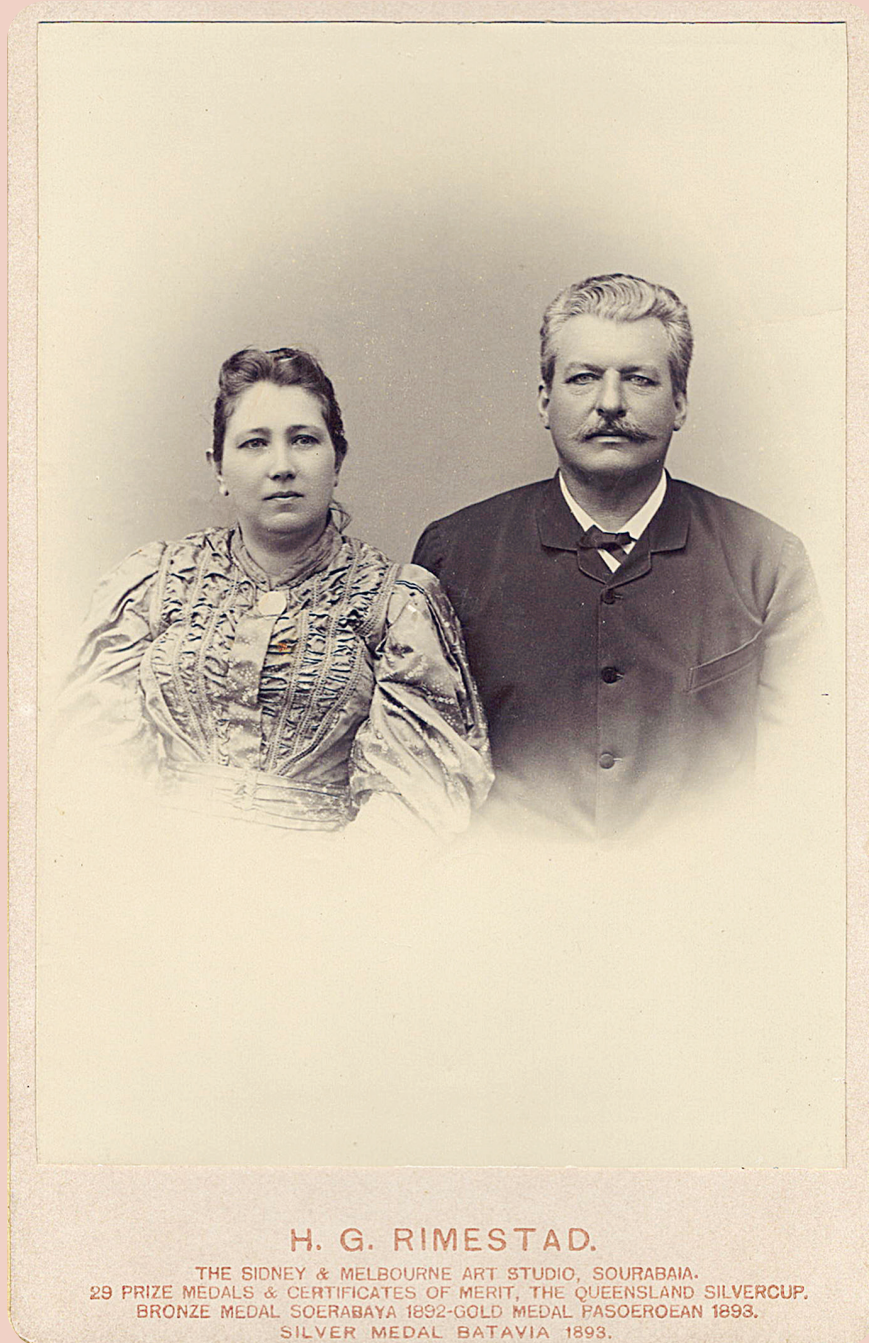
1 (Seite/Page 21) Wasserfall, Java, ohne Datum (ca. 1900). Waterfall, Java, undated (ca. 1900).