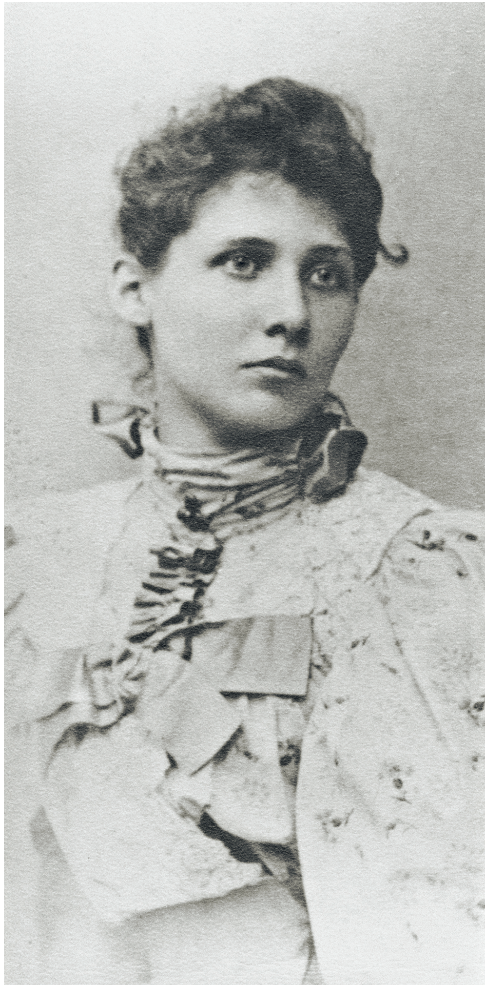
5 Ita Wegman, ohne Datum. Ita Wegman, undated.