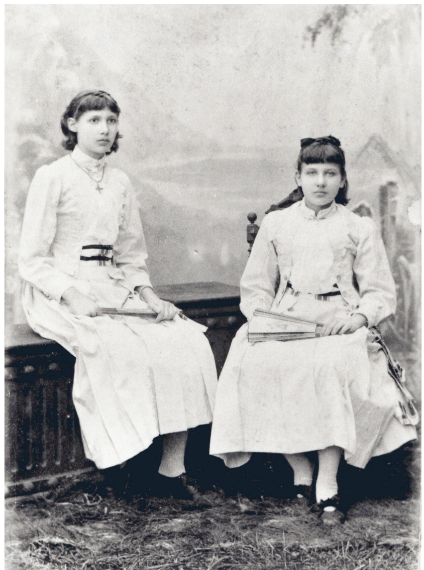
Ita Wegman, ohne Datum. Ita Wegman, undated.